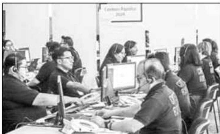
▲ En las instalaciones centrales del Instituto Electoral local se realizó ayer el primer simulacro de conteo rápido y del PREP, en los que participan 3 mil 969 trabajadores eventuales, entre capturistas, estudiantes y técnicos de procesamiento de datos.

“Desde siempre tenemos la previsión de tener nuestras plantas de energía; tenemos una aquí en oficinas centrales y cada oficina distrital tiene su planta, porque es una