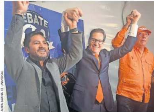
En el último debate chilango Salomón Chertorivski estuvo acompañado por el líder nacional naranja Dante Delgado.