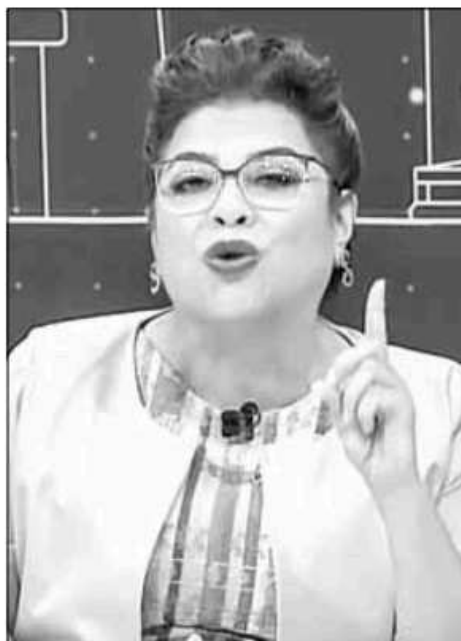
▲ Clara Brugada, abanderada de la coalición Sigamos Haciendo Historia.