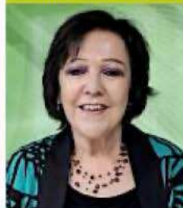
Elena Azaola, Profesora investigadora emérita del CIESAS

Acusaciones y defensas que quitaban tiempo a las propuestas. No cuestionan el enfoque punitivo, cómo implementar la justicia restaurativa".