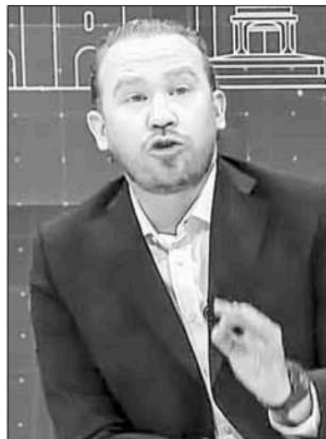
▲ Santiago Taboada, aspirante de la coalición Va por la CDMX.

El candidato de MC propone implementar Fuerza Capital // Buscará crear una nueva fiscalía // Llama a elegirlo a él, ya que sí conoce la ciudad