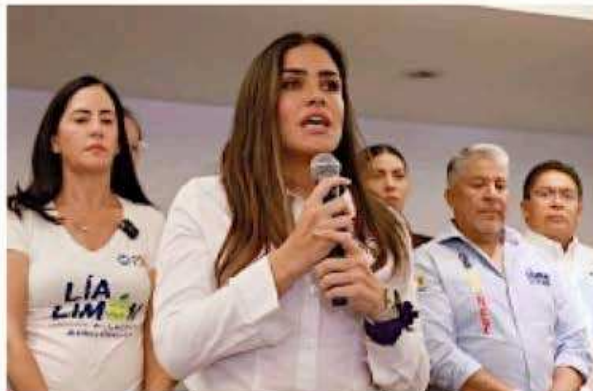
■ Projo de la Vega aseguró que mantendrá su campaña, pese al atentado que sufrió en la Colonia Peralvillo.

“Ha sido una jornada sumamente violenta, nos avientan petardos, nos pegan, nos