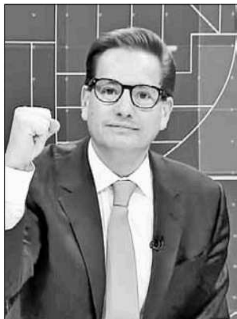
▲ Salomón Chertorivski, candidato de Movimiento Ciudadano.